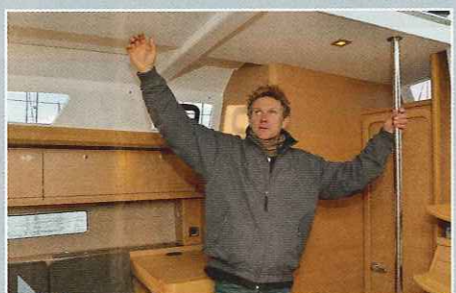
Pas pratique Les mains courantes sont d'autant plus indispensables que le Dufour 500 est très large.