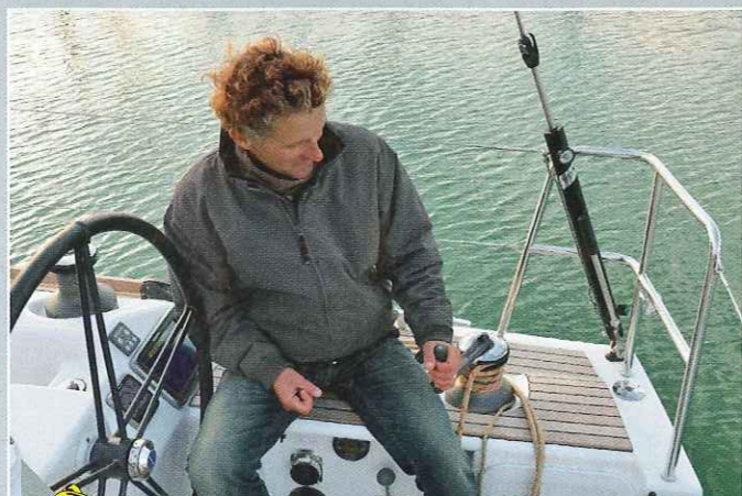
Pas pratique Dans cette position, le barreur n'a pas beaucoup de force pour mouliner et gêne la course de la manivelle.