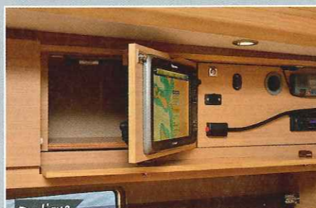
Pratique Le panneau dans lequel est encastré l'écran du GPS s'ouvre sur le côté et est maintenu par un vérin.