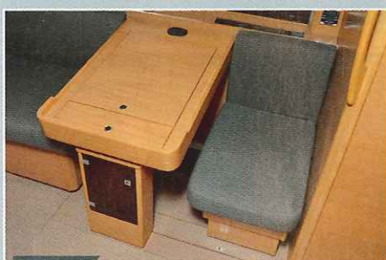
Pratique La table à cartes et son siège s'inclinent pour s'installer confortablement à la gîte.