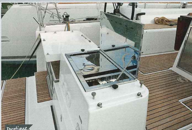
Pratique On circule facilement autour de la plancha quand on ouvre le tableau arrière basculant.